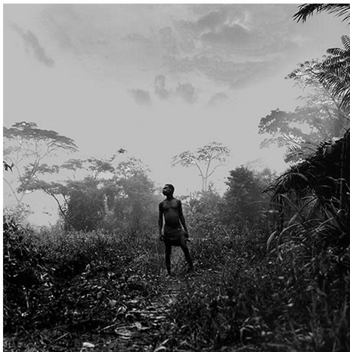
Photo de Bernard Descamps, «Pygmées, l'esprit de la forêt» aux éditions Marval